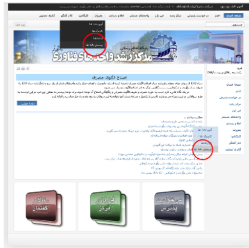
پرسش نامه ها